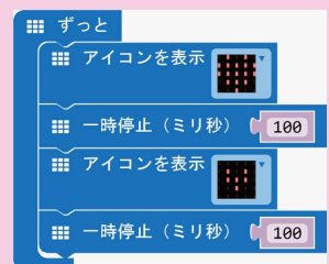
点滅するハートのプログラム

micro:bit は、イギリス BBC が中心となって、教育用として開発された小型コンピューターです。