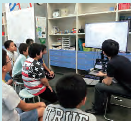
チームで協力し合って大会出場を目指します。

ロボット・ラボは、自律型サッカーロボット(自分でボールを探して行動するロボット)をつくりながら、センサーの活用法、プログラムの考え方を学び、仲間と協力して、ロボカップジュニアなど競技会への出場をめざします。ロボット製作を通じて、楽しみながら、論理的な思考力と技術を身につけることができます。