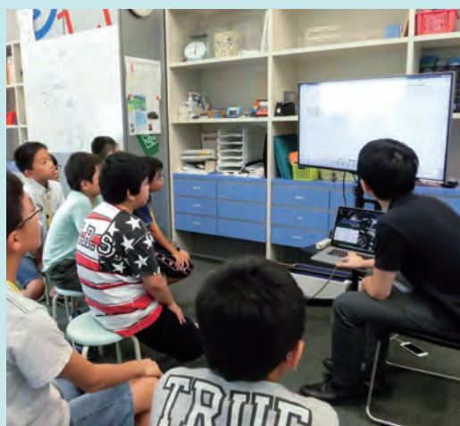
チームで協力し合って大会出場を目指します。

ロボット・ラボは、自律型サッカーロボット(自分でボールを探して行動するロボット)をつくりながら、センサーの活用法、プログラムの考え方を学び、仲間と協力して、ロボカップジュニアなど競技会への出場をめざします。ロボット製作を通じて、楽しみながら、論理的な思考力と技術を身につけることができます。