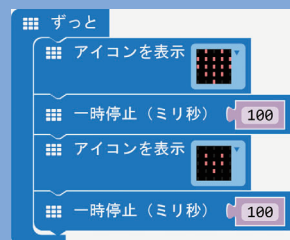
点滅するハートのプログラム

micro:bit は、イギリス BBC が中心となって、教育用として開発された小型コンピューターです。