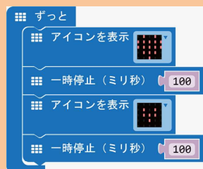
点滅するハートのプログラム

micro:bit は、イギリスBBCが中心となって、教育用として開発された小型コンピューターです。