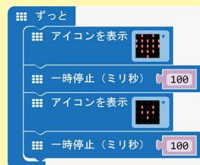
点滅するハートのプログラム

micro:bit は、イギリスBBCが中心となって、教育用として開発された小型コンピューターです。