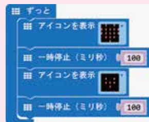
点減するハートのプログラム

micro:bit は、イギリス BBC が中心となって、教育用として開発された小型コンピューターです。