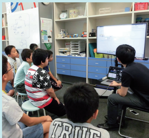
チームで協力し合って大会出場を目指します。

ロボット・ラボは、自律型サッカーロボット(自分でボールを探して行動するロボット)をつくりながら、センサーの活用法、プログラムの考え方を学び、仲間と協力して、ロボカップジュニアなど競技会への出場をめざします。ロボット製作を通じて、楽しみながら、論理的な思考力と技術を身につけることができます。